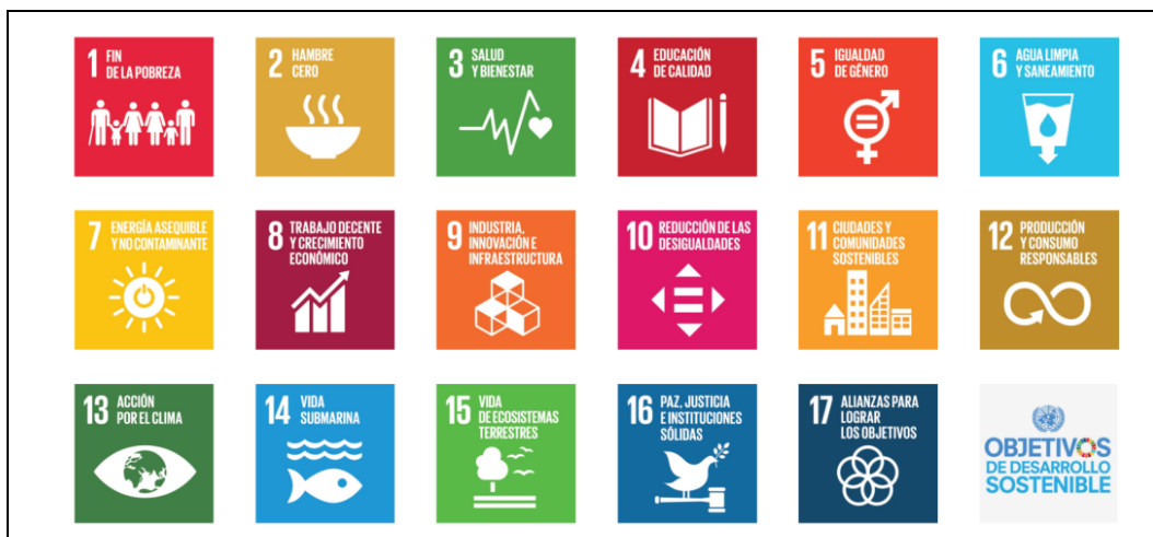
Figura 3 Objetivos de desarrollo sostenible